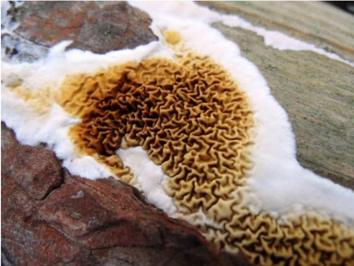
Hier is ze dan de dakloze huiszwam