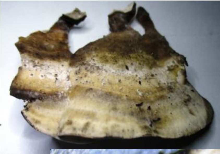
De grijze buisjeszwam