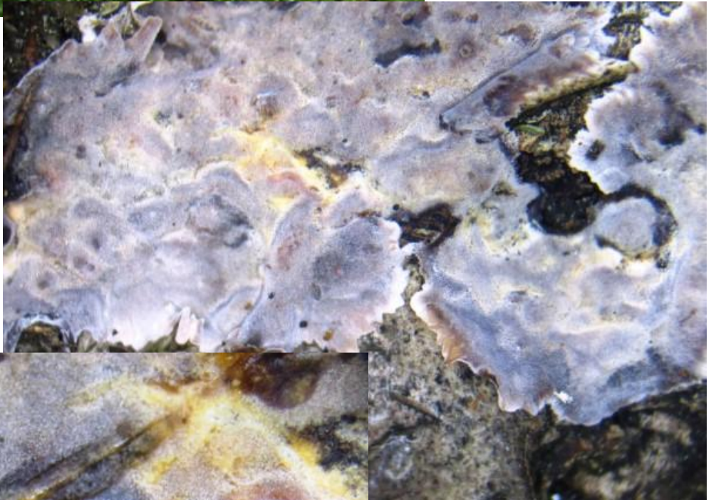
De gerimpelde korstzwam