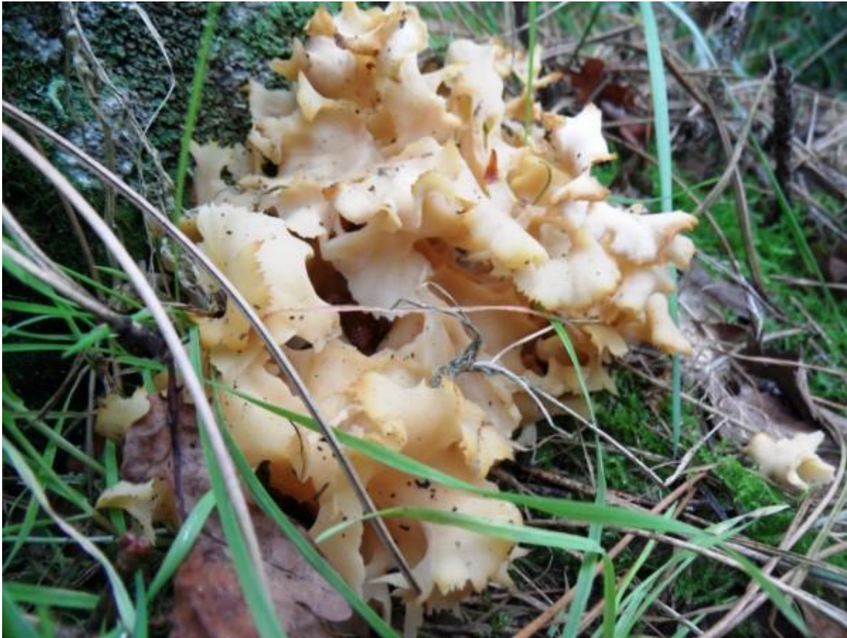
De grote sponszwam